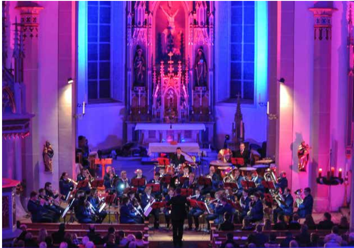
Die Musikgesellschaft brachte den Zauber von Weihnachten mitsamt Lichtermeer in die Pfarrkirche Villmergen.

Im bunten Licht der Kirche entführte das Ensemble der regionalen Musikschule Wohlten die Zuschauer nach Irland. Mir ihren fröhlichen Klängen stimmten sie auf die nachfolgenden Stücke ein.