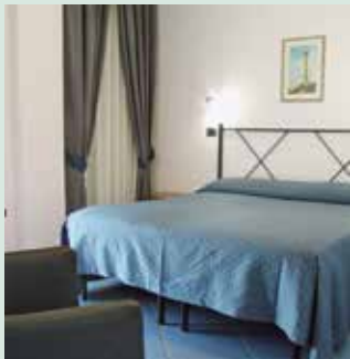
Zimmer im Hotel La Sorgente

Wir wohnen fünf Nächte im guten Mittelklasshotel La Sorgente T-*** (off. Kat. *****) in Savalletri di Fasano. Das Hotel liegt direkt am Meer im Zentrum von Savalletri, ein pittoreskes Fischerdorf. Die 42 Zimmer sind alle mit Dusche oder Bad/WC, Klimaanlage, Minibar, Safe, TV und Telefon ausgestattet. Weitere Einrichtungen des Hotels: Restaurant, Bar und Aussen-schwimmbad (saisonal geöffnet).