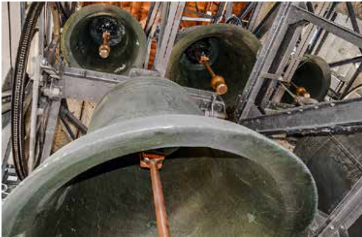
Die imposanten Glocken der katholischen Kirche Peter und Paul.

Keine Messe, kein religiöser Anlass und keine Viertelstunde entgehen den sieben Glocken der katholischen Kirche in Villmergen. Ihr Klang reicht weit über die Dorfgrenze hinaus. Ein Besuch im Kirchturm.