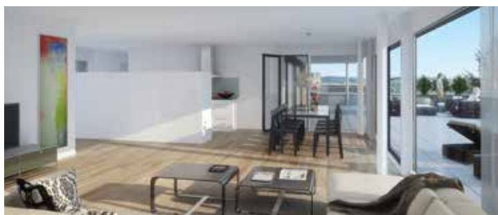
Grosse Fensterfronten und weitläufige Terrassen verleihen den Häusern ihre ganz besondere Note.

Gegen die Terrasse sind alle Wohn- und Schlafräume angeordnet. Rückwärtig gegen den Hang befinden sich die Nebenräume. Der grosszügige Elternbereich mit optionaler Ankleide und integriertem Badezimmer lässt viele Gestaltungsmöglichkeiten offen.