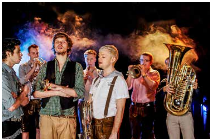
«Federspiel» aus Wien verzaubert Villmergen zum Jahresanfang mit aussergewöhnlichen Blasmusikklängen.

«Aussergewöhnliche Musik eines aussergewöhnlichen Ensembles aus Wien» wird am Freitag, 1. Januar um 16 Uhr in der katholischen Kirche aufgeführt.