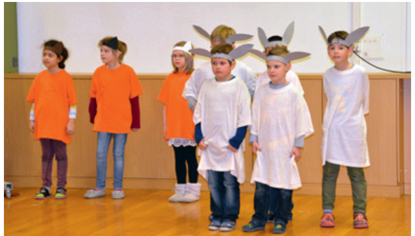
Theaterspielen wird in der EK auch in Zukunft möglich sein.