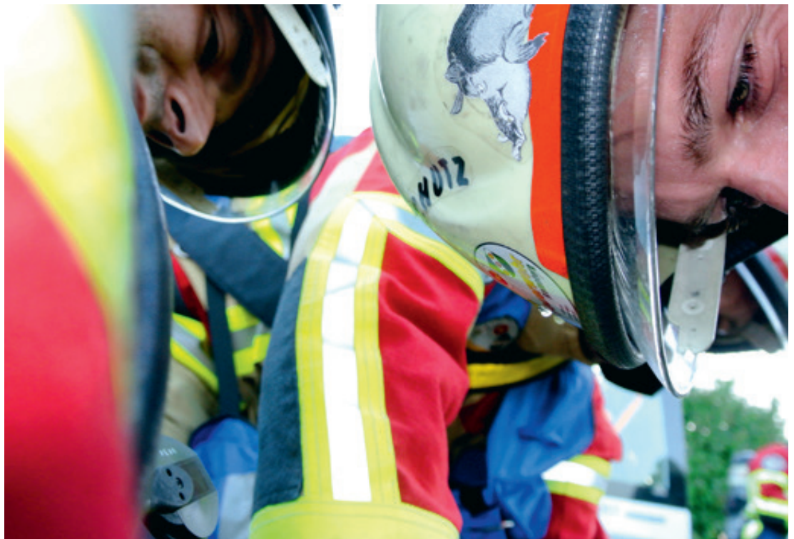
Besorgte Retter der Feuerwehr Rietenberg beugen sich über das Opfer.

«Der Boden ist hart, die Luft heiss und stickig. Um mich herum Rauch, der die letzten Sonnenstrahlen verschluckt. Gespenstisch, Sekunden vergehen wie Minuten, Minuten wie Stunden. Die Hoffnung auf eine baldige Rettung aber ist gross. Von weiter Ferne dringt das Geräusch der Sirenen durch den Rauch. Plötzlich geht alles ganz schnell. Die Zugtüren werden aufgestossen, Männer treten herein, schwer hört sich der Atem in ihren Atemmasken an. Jemand spricht mich an, kann nichts erwidern. Meine beiden Retter ziehen mich routiniert unter dem Sitz hervor und tragen mich nach draussen. Dort kümmert sich bereits jemand um die anderen Verletzten – und nun auch um mich. Ich hatte Glück.