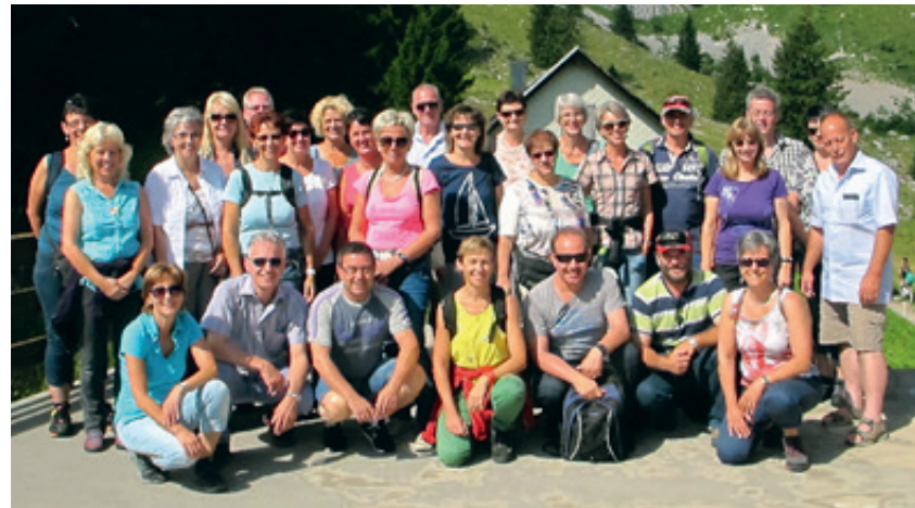
Die 63er auf ihrem Ausflug nach Einsiedeln inklusive Einblick in die Skisprung-Welt.

Wenn Engel reisen: Die Jahrgänger 1963 berichten von ihrem Zweitagesausflug nach Einsiedeln.