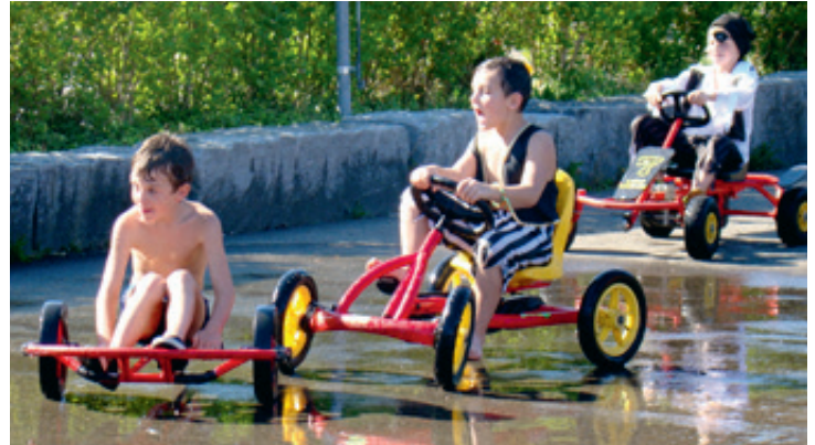
Bei der Wasser-Rallye konnten sich die Kids am Spielfest abkühlen.