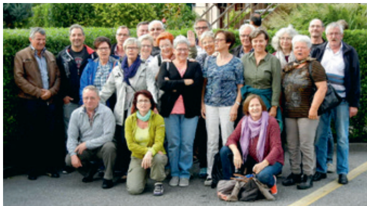
Die «Chriesilöchler» auf der Geburtstagsreise im Engadin.

Die «Chriesilöchler», wie sich die Villmerger mit Jahrgang 1955 auch nennen, feierten ihren 60. Geburtstag mit einer dreitägigen Reise ins Engadin.