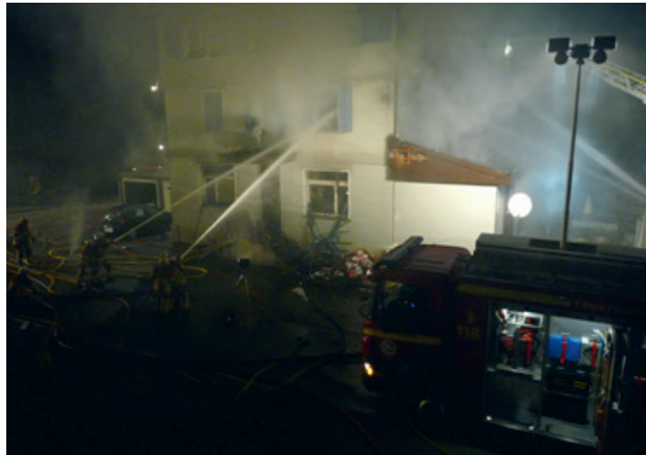
Mit einem Grosseinsatz löschten die Feuerwehren Rietenberg, Wohlen und Muri den Brand im ehemaligen «Frohheim» und retteten die sechs Bewohner.