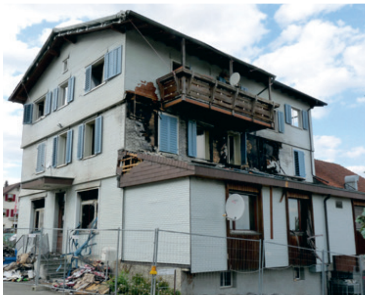
So sieht das ehemalige Restaurant «Frohheim» nach dem Brand aus.