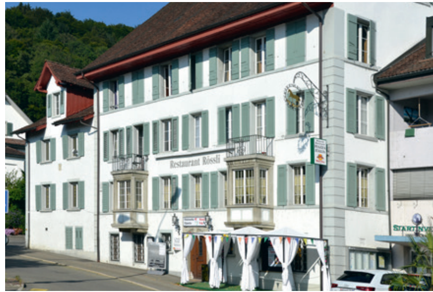
Das Rössli ist geschlossen – nimmt das Beizensterben kein Ende?

Betroffen von der Schliessung des Rösslis ist auch der Kulturkreis,