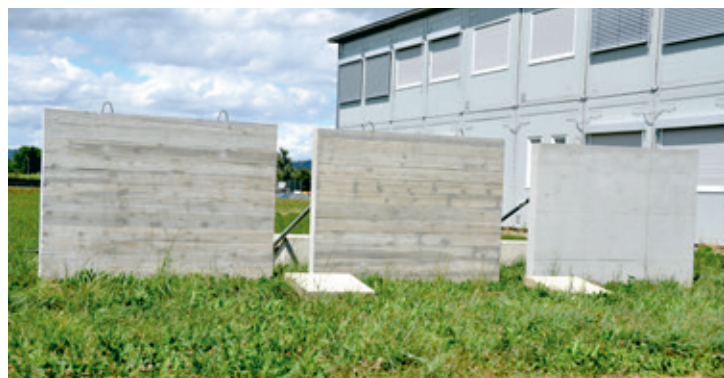
Welche soll's denn sein? Beton-Musterplatten für die Oberflächenausführung.

Wann der Startschuss für den Bau des Mittelstufen-Schulzentrum Mühlematten fällt, ist noch unklar. Jetzt stehen schon mal Musterplatten auf der Wiese.