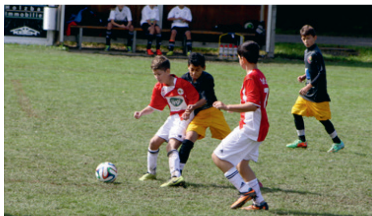
Vom 14. bis 16. August jagen auf der Badmatte kleine und grosse Fussballer dem runden Leder nach.