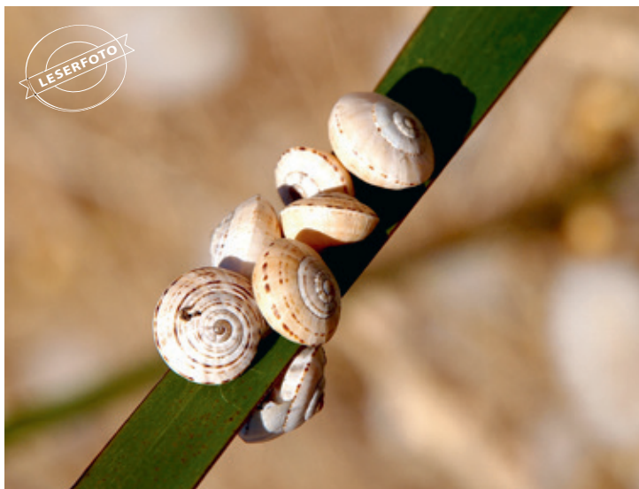
Gabi Bucher aus Villmergen hat diese Gruppe auf ihrer Australien/Neuseelandreise festgehalten: Gemütlich unterwegs – mach mal Pause!