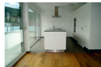
Die Teuerste: 3½-Zimmer-Attikawohnung, 139 m 2 , Alte Bahnhofstrasse 50, CHF 2660.– / Monat.

nicht nur grosse und offene Räume, sondern auch viele Freiheiten im Bezug auf deren Gestaltung. Wieso ist die Wohnung trotzdem noch nicht vermietet? «Das dürfte wohl am Preis liegen», erklärt