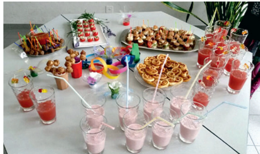
Im Kurs «Summertime-Partytime» von S&E stellten die Mädchen und Jungs leckeren Fingerfood her und mixten coole Drinks.

13 Mädchen und Jungs konnten beim Kurs «Summertime-Partytime» des Vereins Schule&Elternhaus (S&E) coole Drinks und leckeren Fingerfood herstellen.