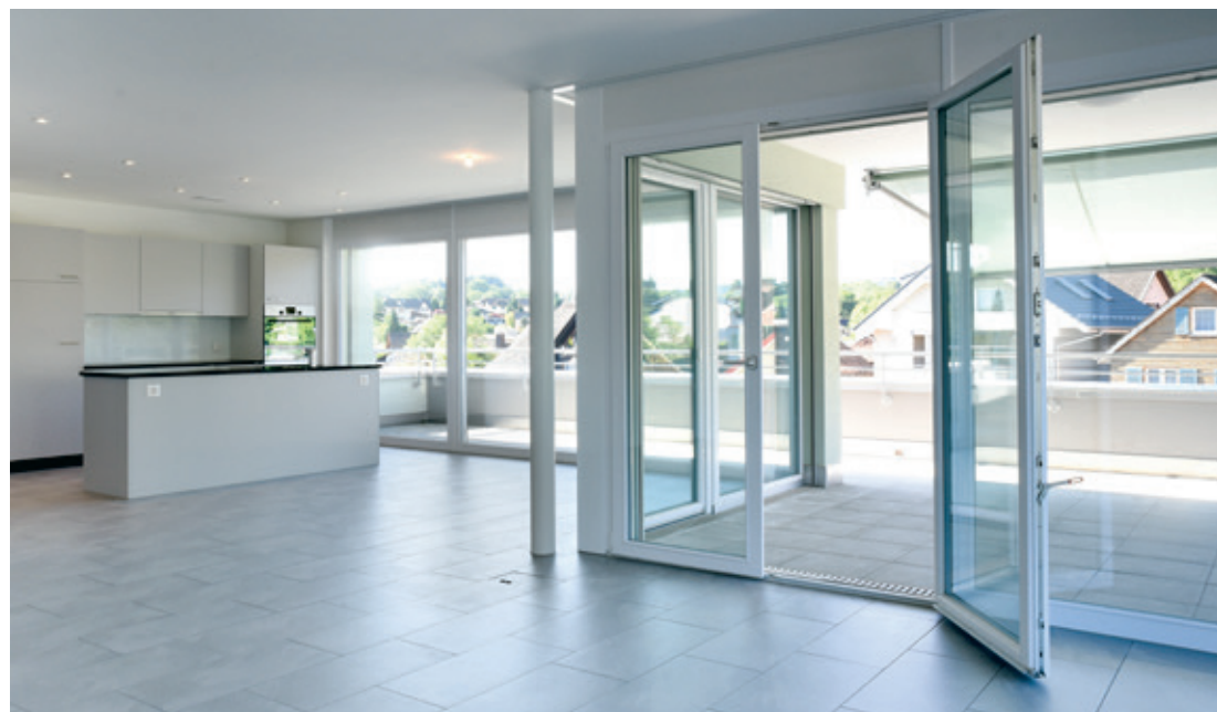
Die Schönste: 3½ Zimmer-Attikawohnung, 96 m 2 , Oberdorfstrasse 9, CHF 2480.– / Monat.