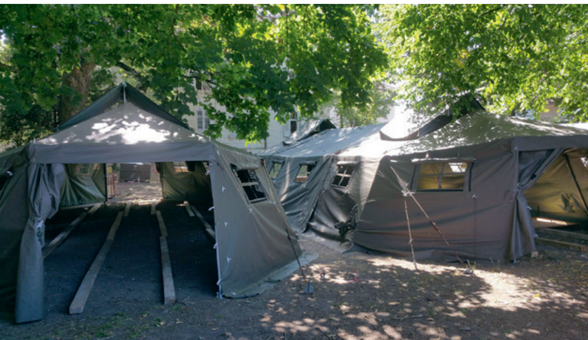
In drei solcher Zelte sollen in Villmergen zusätzliche 30 bis 45 Asylsuchende wohnen.

Weil die kantonalen Asylunterkünfte komplett überlastet sind, baut die Armee derzeit auch in Villmergen drei grosse Zelte auf, in denen ab nächster Woche insgesamt 30 bis 45 Asylsuchende untergebracht werden. Allerdings nur den Sommer über, dann muss man weiter sehen.