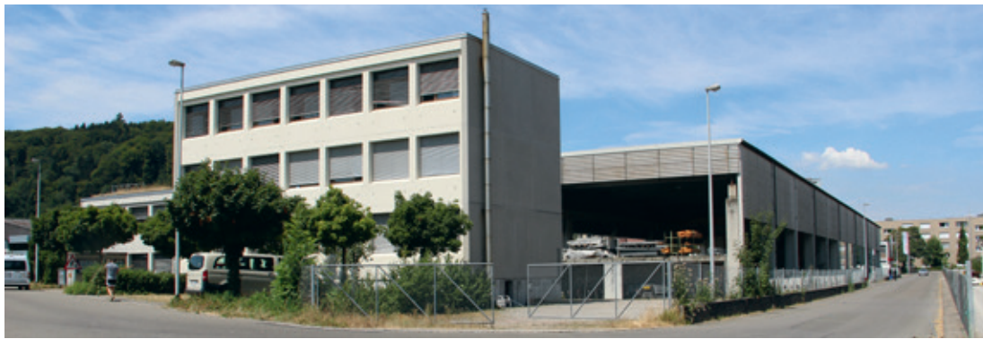
Zwei Zelte sollen hinter dem Haus, eines auf dem kleinen Kiesplatz neben dem Gebäude zu stehen kommen.

abrunden, heisst es seitens des Kantons.