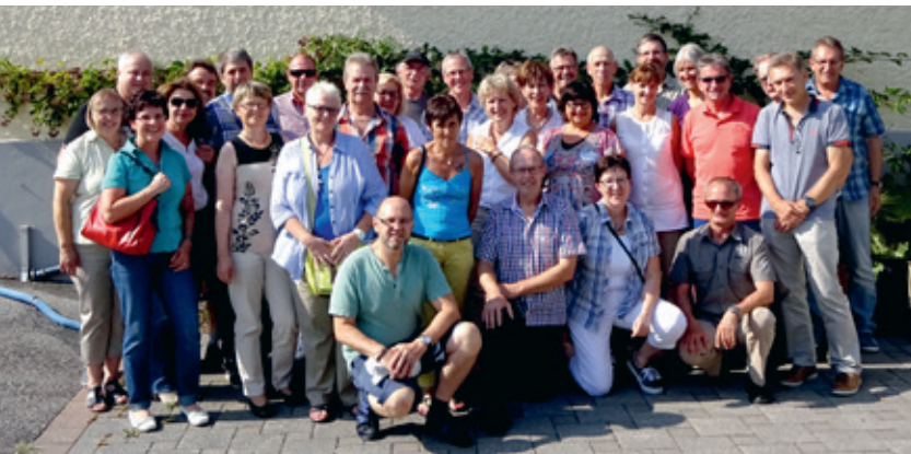
Die Villmerger mit Jahrgang 57 stellten ihren eigenen Käse her.

Eigenen Käse wollten die 57-er herstellen. Darum reisten sie an einem frühen Samstagmorgen Richtung Goldingen. Die Fahrt ging zuerst nach Rapperswil-Jona, wo sich die Gruppe im Restaurant Steinbock bei Kaffee und Gipfeli für die Stadtführung stärkten. Die beiden Tourleiter erzählten viel Interessantes über die Altstadt, das Schloss und den Pilgerweg. Nach dem feinen Mittagessen mit Seeblick von der