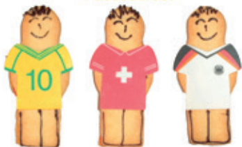
Feine Spitzbubenfussballer zur WM.

Wir sind bereit für ein fröhliches Fussballfest