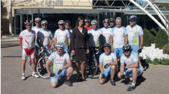
Der Villmerger Veloclub trainierte sich die nötige Fitness für die diesjährige Saison in der Toskana an.

Der Veloclub Villmergen reiste in die Toskana, um sich dort auf die Velosaison vorzubereiten. Mit 650 Trainingskilometern in den Beinen reiste man zurück.