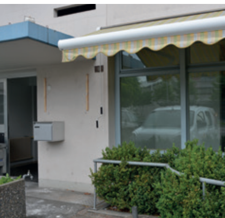
Die Kleiderbörse ist endgültig weg, «Startinvest» eröffnet am Montag.

Seit letztem Herbst ist die Spiel- und Kinderkleiderbörse «Piccolo» geschlossen, nun sind auch die Verkaufsräume leer. Bereits in den nächsten Tagen eröffnet ein neues Geschäft.