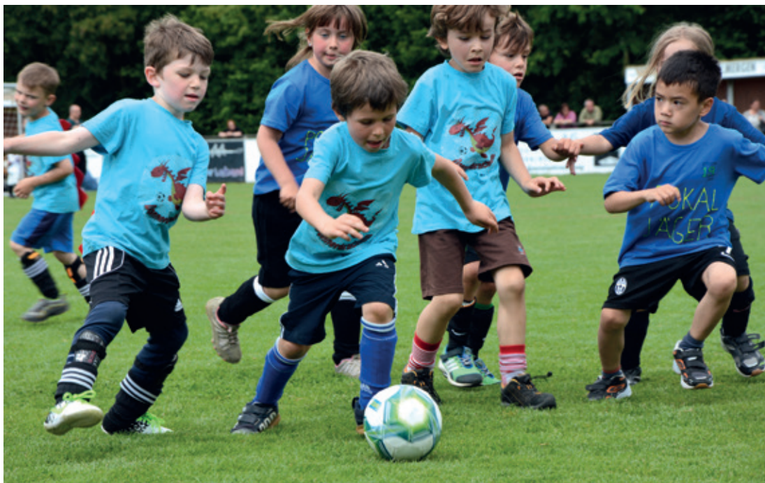
Auch die Kleinen blieben hart am Ball: Der «FC Donnerdrachen» und die «Pokal-Jäger» schenkten sich nichts.

Ein wahres Volksfest fand an Auf-fahrt auf dem Fussballplatz Bad-matte statt. Hunderte Eltern und Kinder tummelten sich auf dem grünen Rasen. Ein farbenfroher Anblick, hatten sich die Mann-schaften doch einiges zu ihren Outfits einfallen lassen. Da grin-ten knallrote Killertomaten von den Shirts, zierten Drachenzack-ken die Rücken, und eine Mann-schaft hatte ihrem Leibchen ein-en Fussballschuh verpasst – samt Schnürsenkeln auf dem Bauch und Stollen auf dem Rücken. Auch die Mannschaftsnamen zeugten von einiger Fantasie: Ob «Lattenknaller» oder «Treffi-scher», «Fürbölle» oder die «Wild-sauen», zumindest die Namen versprachen schon mal einiges.