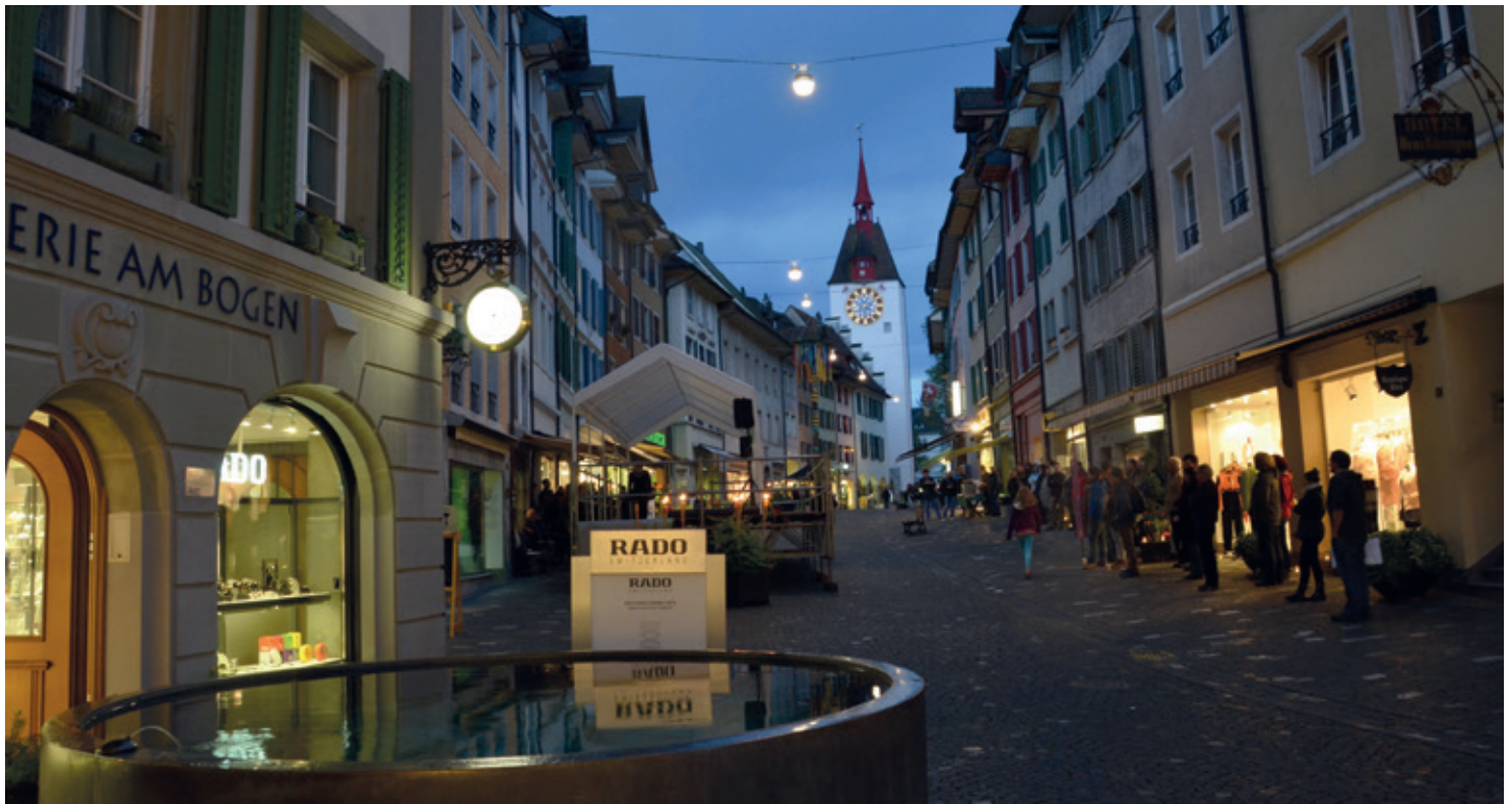
Die charmante Altstadt Bremgartens in der mystischen Vollmondnacht.

Zum Maienfest in der Vollmondnacht konnten die Besucher in mystischer Atmosphäre bis 22 Uhr in den Fachgeschäften der Bremgarter Altstadt stöbern. Die Stimmung blieb trotz Regen heiter. In den historischen Gassen waren irische Volksklänge zu hören und eine Tanzgruppe begeisterte die wetterfesten Besucher.