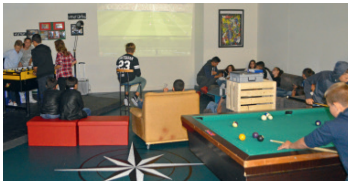
Nebst dem Jugendtreff wünscht sich die Villmerger Jugend noch weitere Freizeitmöglichkeiten.

Im Grunde gilt für die Jugendlichen dasselbe wie für die Senioren: Sie sind überwiegend zufrieden. Über 90 Prozent fühlen sich in der Gemeinde ernst genommen oder sogar vollumfänglich