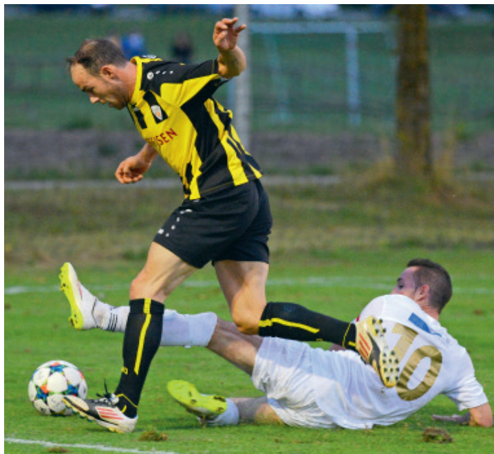
Das Villmerger Fanionteam lässt sich weiterhin nicht ausbremsen.

Mit diesem Vorsprung ging es auch in die zweite Halbzeit. Villmergen suchte die endgültige Entscheidung, welche bald Tatsache wurde. Sax nützte die herrliche Vorarbeit von Koch in der 55. Minute zum 3:1. Als Zugabe gab es für den FCV noch