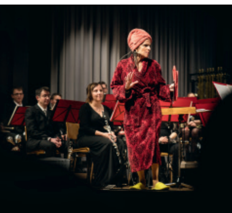
Das Trio Mortale hielt zwischendurch szenische Lesungen.

Im Anschluss an die Aufführung galt es, den Abend bei einem gemütlichen Zusammensein in der Whiskybar oder in der Halle ausklingen zu lassen. Auf den Heimweg ging es dann gutgelaunt, in den Ohren immer noch die Töne aus der Welt der Detektive, Helden und Agenten.