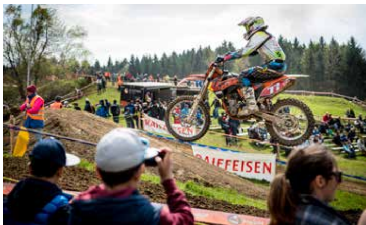
Die Zuschauer erleben am Samstag und Sonntag in Hilfikon packenden Motorsport hautnah.