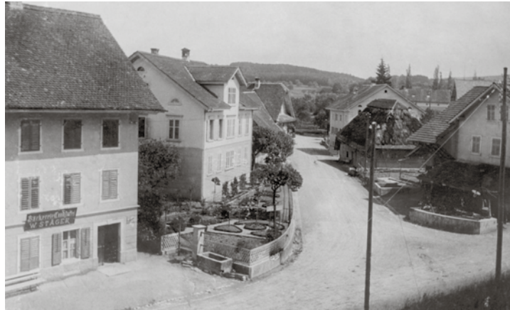
Im Wagnerhaus (links) an der Mitteldorfstrasse 29 wurden schon Brot, elektronische Geräte und Antiquitäten verkauft.