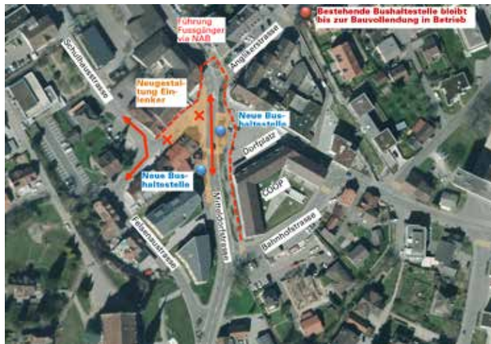
Die Bushaltestellen werden von der Anglikerstrasse in den Dorfkern verlegt. Gleichzeitig entsteht eine neue Verkehrssituation mit einer Einbahn. Skizze: zg

Durch den Neubau von zwei Bushaltestellen im Bereiche des Dorfplatzes wird die Haltestelle Zentrum von der Anglikerstrasse an die Mitteldorfstrasse verlegt. «Die bestehenden Bushaltestellen entsprechen nicht mehr den heutigen Anforderungen, welche an Haltestellen im Dorfkern gestellt werden», erklärt Bauverwalter Studer. Ein Ausbau der Haltestelle an der Anglikerstrasse sei aufgrund der Platzverhältnisse und der Lage neben dem Bach, der Parkhaus-Ausfahrt sowie der