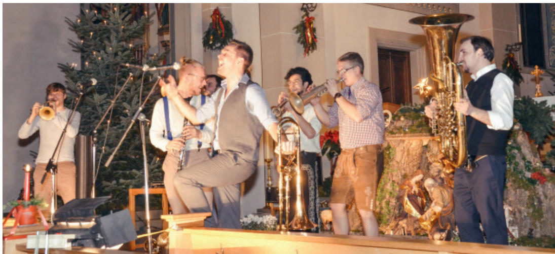
«Federspiel» blies sich mit Können und Schalk in die Herzen des Publikums.

Frisch ihr Auftreten, überraschend ihre Musikwahl, unkonventionell ihre Kleidung, überraschend der Einsatz ihrer Instrumente, verblüffend ihre Virtuosität. Da wurde der Rhythmus schon mal durch Schlagen auf Mundstücke und Instrumente vorgegeben – ganz in Beatbox-Manier.