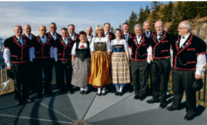
Der Jodlerklub «Heimelig» im Mai 2015 auf dem Stanserhorn.