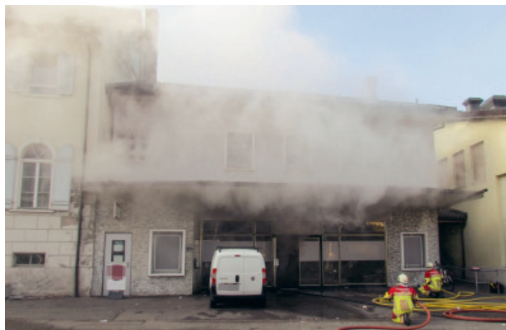
Der Brand in der Shisha-Bar wurde durch die Feuerwehr Rietenberg rasch gelöscht. Trotzdem entstand ein beträchtlicher Sachschaden.

Wo bisher nur Rauch war, kam kurz vor Jahresende auch noch das Feuer hinzu. In der Timeless Shisha Lounge brach am 27. Dezember ein Brand aus und verursachte enormen Sachschaden. Wie es weitergeht im Villmerger Dorfzentrum, ist derzeit noch ungewiss.