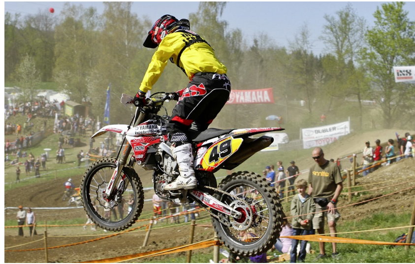
Die Hilfiker Rennstrecke wird am Wochenende vom 13. und 14. April das Mekka für Rennsportbegeisterte aus Nah und Fern.

Auch in diesem Jahr muss, neben aller Bodenständigkeit, etwas Spezielles sein. Diesmal findet ein Show-Fun-Lauf mit verkleideten Fahrern oder Motorrädern statt, prämiert von einer Jury. Auf