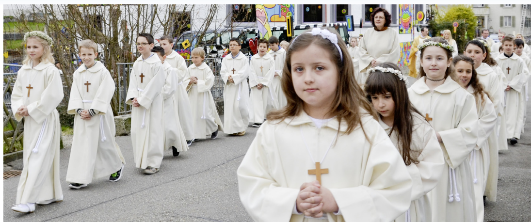
Weisser Sonntag: Für 47 Mädchen und Buben fand am Sonntag, 7. April, die Erstkommunion statt. Weitere Bilder findet man unter: www.v-medien.ch .