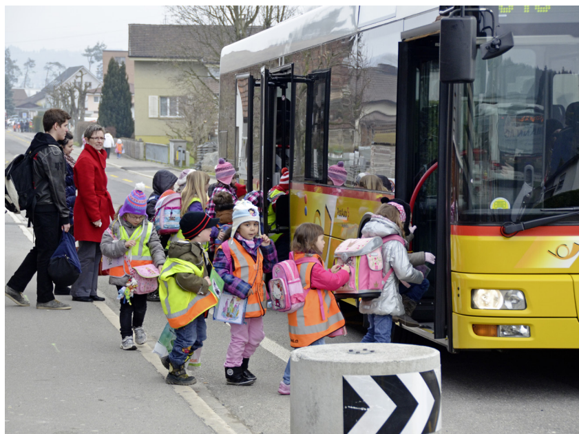
Mit dem Postauto in Kindergarten und Schule gehört mittlerweile zum Alltag in Villmergen. Damit es weiterhin rund läuft, sind Anpassungen nötig.

Schule und Postauto AG planen einen Verkehrsunterricht zum Busbetrieb und dem respektvollem Verhalten gegenüber den Mitpassagieren. Den Eltern im Ballygebiet und in Hilfikon werden im Juni einige übertragbare Gratisbillette angeboten, damit