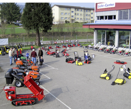
Die Ausstellung zeigt Geräte für Heimwerker und Profis.