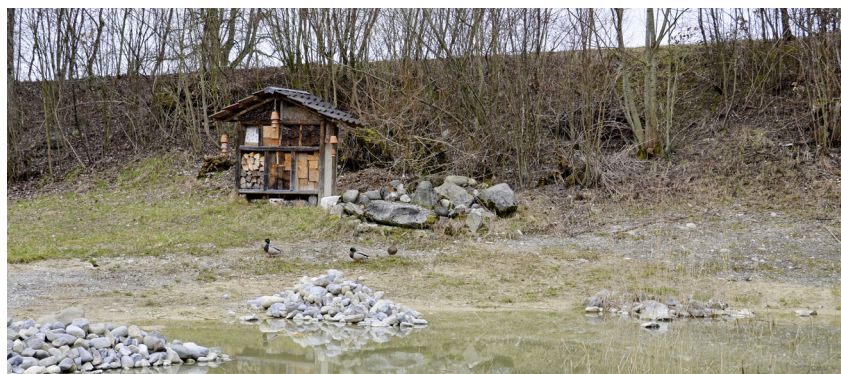
Mit dem «Bünztalpreis 2012» ausgezeichnet: Das Naturschutzgebiet Unterzelg, das vom Natur- und Vogelschutzverein gepflegt wird.