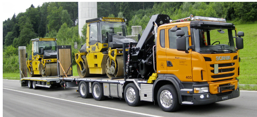
Neu im Fahrzeugpark seit letztem Jahr: Das Vier-Achs-Kranfahrzeug, schweizweit ist es das erste dieser Art.