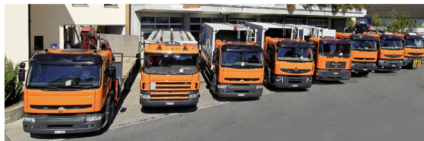
Acht topmoderne Fahrzeuge für die verschiedensten Verwendungen stehen zur Verfügung.

Weitere Informationen findet man unter: www.koch-fuhrhaltereirei.ch . Text und Bilder: nw und zg