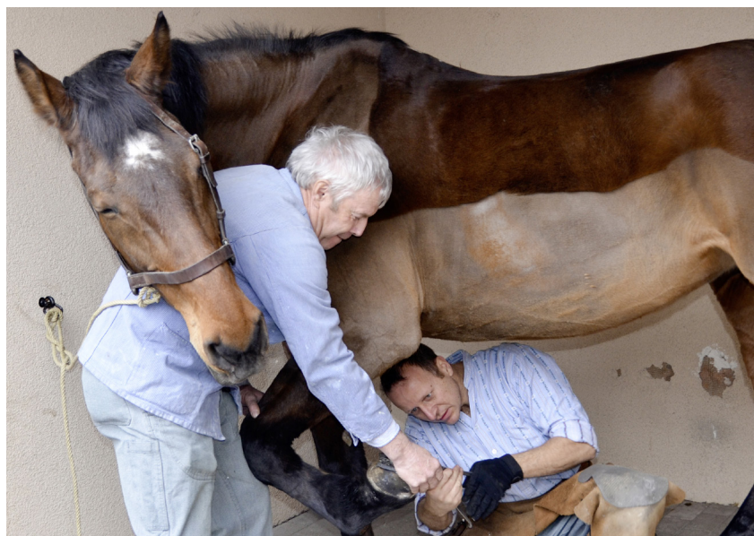
Wann seid ihr endlich fertig mit meinem neuen Hufeisen?

Und was es mit der 1929 erlegten Wildsau Charlotte auf sich hat-