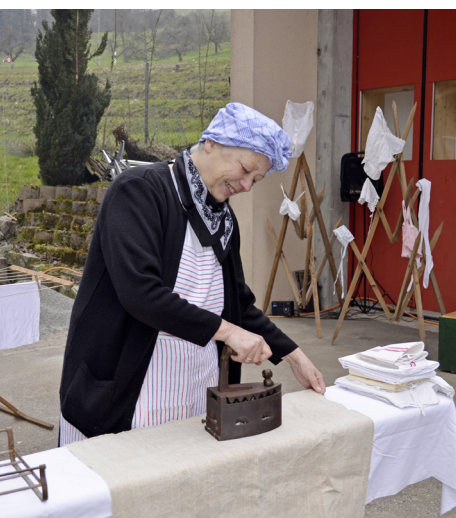
Bügeln nach alter Manier.

Weitere Bilder findet man auf www.v-medien.ch