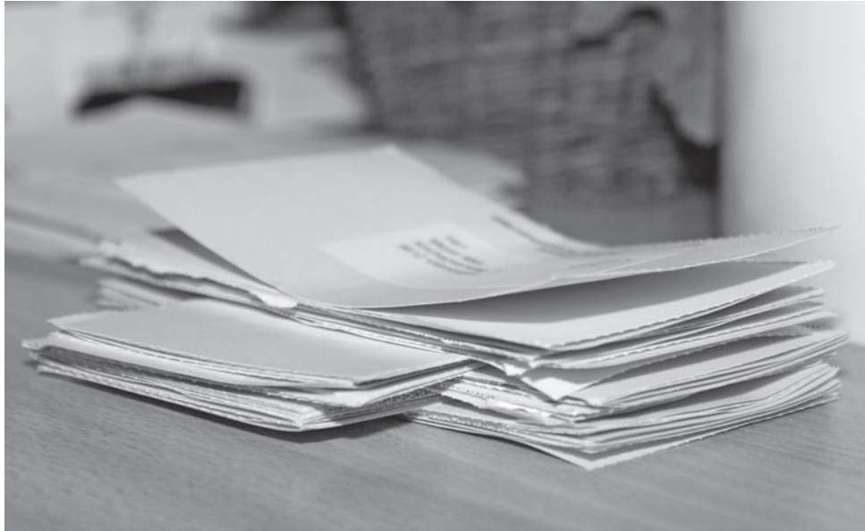
Als Aktionär der Villmergen Medien AG haben Sie eine wichtige Stimme: Stimmrechtsausweise an einer GV.

Um eine finanzielle Basis und eine strukturierte Organisation sicherstellen zu können, haben wir eine Trägerschaft in Form einer Aktiengesellschaft, der Villmergen Medien AG, gegründet. Sie hat ein Aktienkapital von CHF 100'000.00, welches sich aus 100 Namenaktien zu nominal CHF 1'000.00 zusammensetzt.