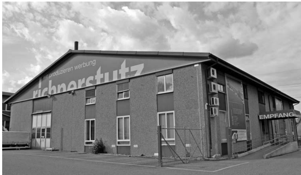
Der Hauptsitz von richnerstutz ag an der Durisolstrasse.

Text: Sandra Donat