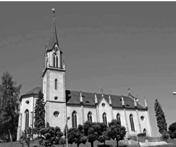
Prägt nach wie vor das sich wandelnde Ortsbild: Die kath. Kirche.

Erinnerungen von Otto Walti, Teil 1 von 3