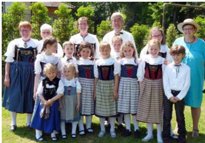
Die Kindertanzgruppe hatte zwei Auftritte.