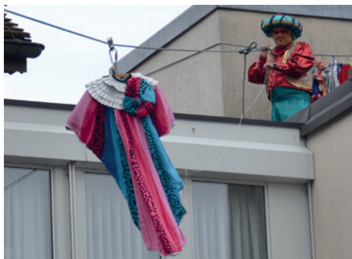
Die verschiedenen Gewänder schwebten auf die Bühne.

Nach der Modenschau wurden die Ehrengäste in der Mehrzweckhalle mit einem reichhaltigen Apéro begrüsst. Dabei wurde den Besuchern die Chronik der «Heid-Heid» von Beginn an erzählt und auf einer grossen Leinwand bildlich näher gebracht. Manch lustige Erinnerung von anno dazumal liess das Publikum herzlich lachen, und aus vielen Ecken tönte es: «Ja genau, weisch no?» Wie es sich an einem Geburtstag gehört, wurde die Fasnachtsgesellschaft von verschiedenen Vereinen und Anwesenden geehrt und beschenkt. Dabei durfte auch die obligate Geburtstagstorte nicht fehlen. Diese wurde von Heiden-Ehrenmitgliedern in einer fantasievollen Auffüh-