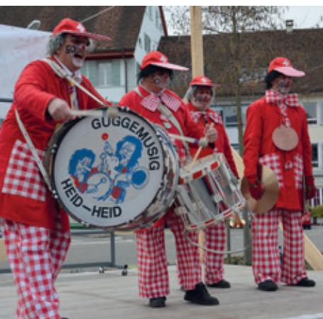
Das «Oldie Guggen»-Kostüm war das erste der «Heid-Heid».