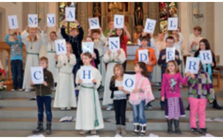
Die Sängerinnen und Sänger des Immanuel-Kinderchors begeisterten bei ihrem ersten Auftritt in der Kirche.

Die neuste Gruppe der Pfarrei St. Peter und Paul Villmergen heisst «Immanuel Kinderchor». Den ersten Auftritt hat der Nachwuchs bravourös gemeistert.