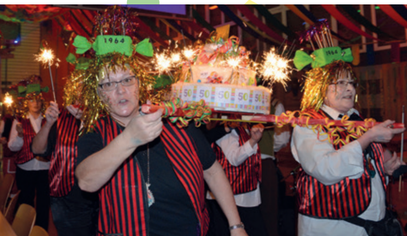
Die Damen der «Oldie Gugger» präsentieren die Geburtstagstorte für die «Heid-Heid».

Heiden Revue passieren und stellten am Ende, unter tosendem Applaus, die Komposition ihres neuen Kostümes vor. Wie aus dem Märchenbuch «Alice im Wunderland» entstiegen, erschien das Gewand des Hutmachers. Eine überaus gelungene