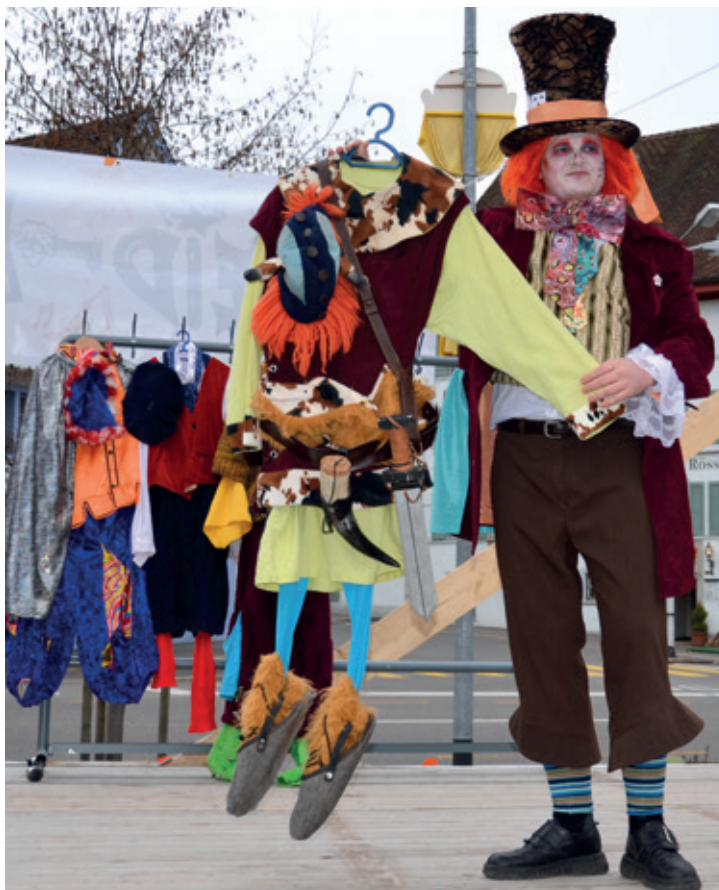
Das Wikinger-Kostüm war letztes Jahr noch im Einsatz.

Mit anspruchsvoller Näharbeit präsentierte sich das Kostüm aus «1001 Nacht». Schön anzusehen und auch sicherlich bequem zu tragen, fand das Sujet grossen Applaus. Nach weiteren Darbietungen ging die Reise der Gewänder ins nahe Frankreich. Passend zum Fasnachtswagen «Moulin Rouge» sahen die Heiden wie echte Franzosen aus. Manche «Cancan»-Tänzerin habe damals den Männern den Kopf verdreht, schmunzelte die Sprecherin. Nach den Jahren mit französischem Chic folgte die Zeit der Trolle. Mit übergrossen Ohren und Füssen waren diese Wesen