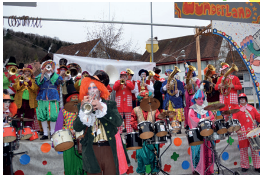
50 Jahre «Gwändli-Geschichte» auf einer Bühne vereint.

Dass der Kultursaal zumindest an der Fasnacht seine volle Berechti-