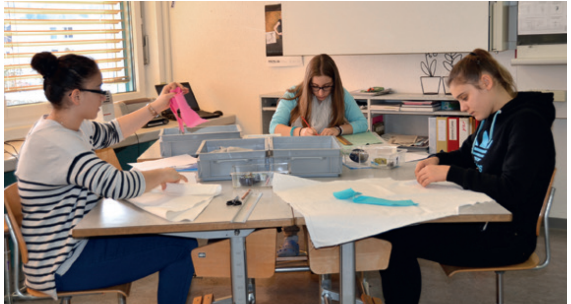
Die Künstlerinnen sind hoch konzentriert bei ihren Kreationen.

Die Jugendlichen entdecken ihre Kreativität und trauen sich, ihre Ideen umzusetzen. Mit jedem gelungenen Schritt werden sie selbstsicherer, und natürlich steigt so auch die Motivation, Neues auszuprobieren. Es wäre blauäugig, zu behaupten, dass alle Schüler von der «Aktion Schürze» begeistert sind. Aber jene, die lieber ein T-Shirt nähen möchten, lernen – wie wohl noch oft in ihrem Leben – dass es unbeliebte Arbeiten geben wird, welche ausgeführt werden müs-