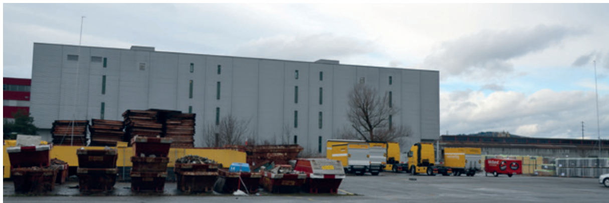
Vom Logistik Center in Villmergen aus werden Pakete ins Mittelland verteilt. Nun will die Post das Center ausbauen.

Nun wird also der Standort Villmergen gestärkt. Deshalb wird gleich angrenzend an das bestehende Gebäude das unterkellerte Warenumschlaglager mit 14 LKW-Andockstellen geplant. Das Erdgeschoss soll dem Warenum-