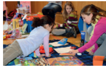
«Was kostet das?» – Feilschen am Spielzeug-Flohmi.

Am Samstag, 8. März, findet in der Mehrzweckhalle der beliebte Spielzeugflohmi statt. Zwischen 11 und 13 Uhr kann die Ware zum Kauf oder Tausch angeboten werden.