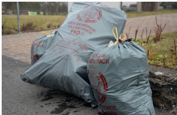
Die Abfallmenge wächst Jahr für Jahr.