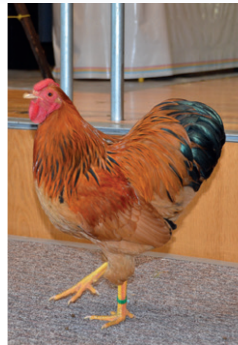
Stolzer Gockel auf dem Laufsteg.

Als Gäste des KTV Villmergen durfte der Cavia-Verein Schweiz (Cavia ist die lateinische Bezeichnung für Meerschweinchen) seine Rassemeerschweinchen ausstellen. Die Heimat der kleinen Nager ist ursprünglich Südamerika. Die Seefahrer brachten die putzigen Tierchen nach Europa, daher stammt auch ihr Name: Meerschweinchen. Es versteht sich von selbst, dass die knuddeligen Nager ein grosser Anziehungspunkt der zahlreichen Be-