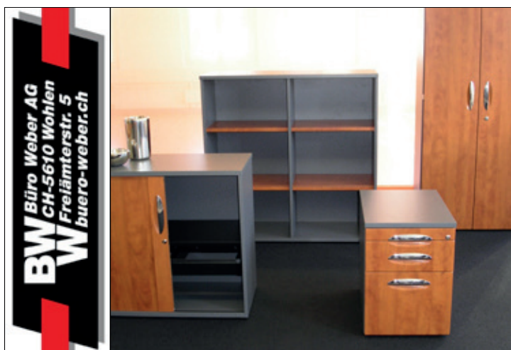
Text und Bilder: sd

Nun wird es heiss in der Garage, das Schweißen beginnt. Die Füsse müssen an den Beinen befestigt werden. Mit Schweissermaske und Handschuhen geschützt, lässt Meyer die Funken sprühen, bis Füsse und Beine eine Einheit bilden. Das gleiche widerfährt Kopf und Hals, auch diese werden aneinander befestigt, dank gleisendem blauem Licht und grosser Hitze. Damit der Kopf auch gerade sitzt, nimmt Meyer einen Winkel zur Hilfe. Nun müssen nur noch der Hals sowie die Beine in die gebohrten Löcher gesteckt werden – fertig ist der kleine Vogel. Ueli Meyer muss ob dessen Anblick selber lachen: «Der ist aber mit grossen Schritten unterwegs, ein dynamischer Bursche.» Dank der vorgefertigten Teile dauerte das Zusammenstellen des Vogels nur 20 Minuten. Was jetzt noch fehlt, ist das Spritzen mit anschliessender Trocknungszeit. Das macht Meyer dann zu einem späteren Zeitpunkt. Zuerst präsentiert er sein neuestes Werk inmitten der anderen bunten Gesellen.