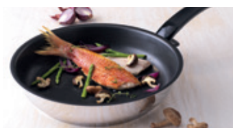
Mit FISLER Bratpfannen richtig einfach richtig braten.

Profitieren Sie von 20 Prozent Rabatt vom 24. Januar bis 15. März auf alle Bratpfannen und Kochtöpfe der Marke FISLER, und geben Sie jetzt Ihre alten Pfannen in Zahlung (egal welches Fabrikat).