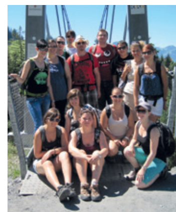
Das Vereinsleben kommt auch vor und nach der Fasnacht nicht zu kurz. Wanderungen und Ausflüge gehören zum Jahresprogramm.

nachts-Szene zu verschaffen. Nebst Auftritten in Villmergen reisen die Frauen und Männer sogar bis ins bündnerische Schiers, um an der dortigen Beizenfasnacht für Stimmung zu sorgen. Höhepunkt für die noch junge Truppe war der Auftritt am Fasnachtsumzug im oesterreichischen Altsch. Dass die «Gugger» alles geben während ihren Auftritten, das stellte ein Neumitglied erst kürzlich unter Beweis: Ob sei-