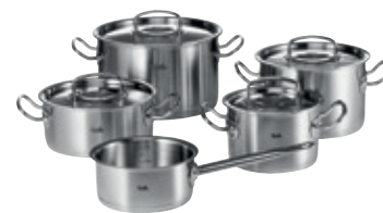
FISLER Kochtöpfe, eine Investition fürs Leben.

Beim Kauf eines neuen Kochtopfes, Dampfkochtopfes oder einer neuen Bratpfanne von FISLER erhalten Sie zusätzlich zehn Franken für Ihre alte Pfanne.