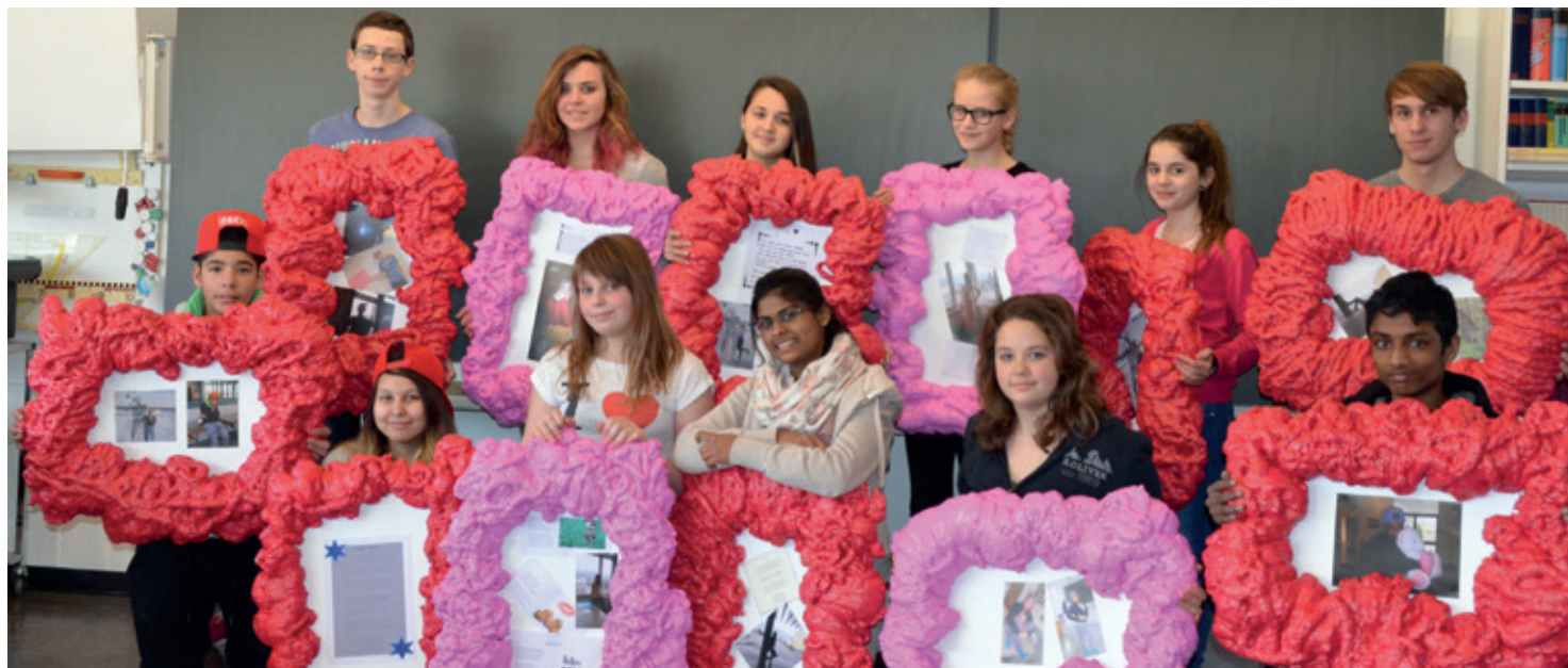
Viel Herzblut steckt in diesen perfekten Geschenken.

In den Villmerger Schulzimmern herrschte letzte Woche Ausnahmezustand: Theaterproben, Kreativ-Workshops, Ernährung und viel Sport standen im Mittelpunkt der Projektwoche.