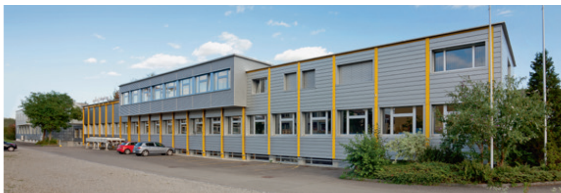
Betriebsgebäude der sprüngli druck ag gegen Westen.

sen Punkten «rumgeritten» und sie waren plötzlich nicht mehr gut genug. Dies löste eine unheimliche Verunsicherung in mir aus, was sicher nachvollziehbar ist. Und dass dies kein grosser Motivationsschub war, versteht sich von selbst. Es führte dann soweit, dass wir den Auditor wechselten, was zur Folge hatte, dass es von dem Zeitpunkt an aufwärts ging. Das Ziel wurde somit endlich greifbar und Ende des vergangenen Jahres hatten wir es geschafft!