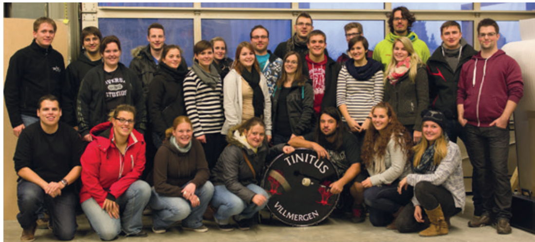
«Tinitus auf Safari» lautet das diesjährige Motto der Guggenmusik.

Die Geschichte der Guggenmusik «Tinitus» geht zurück zur Kinderguggenmusik «Wäschpigügger». Seit fünf Jahren unterhalten die 26 Frauen und Männer in Villmergen und Umgebung mit schaurig-schräger Musik das Fasnachtspublikum.