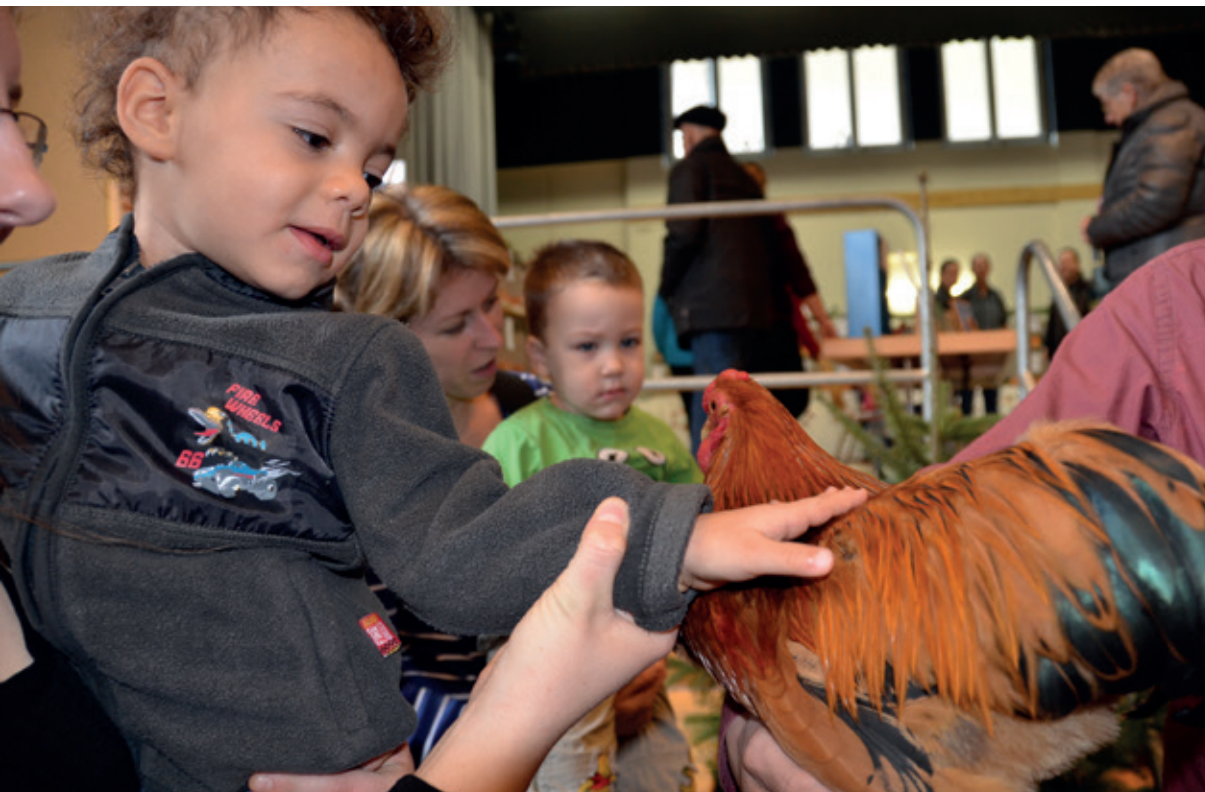
Auch ein Gockel darf gestreichelt werden.

Am Wochenende standen an der Kleintier-Verbandsausstellung die Tiere im Mittelpunkt des Geschehens. Bereits zum 72. Mal präsentierte der Kleintierverein Villmergen den Besuchern in der Mehrzweckhalle Tiere unterschiedlichster Rassen.