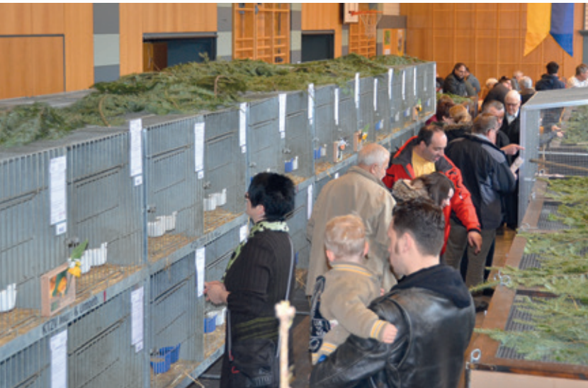
An beiden Tagen fanden sich viele Besucher ein.

suren. Zwischen den Gefiederten waren zudem Mandarin- und Brauenten, Wachteln, sowie ein Gold- und ein prachtvoller Korea Ringfasan zu entdecken.